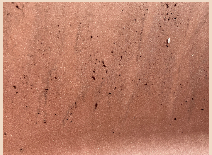
Stonalizzazione e colature